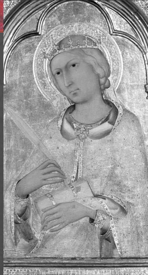
Simone Martini - Polittico di Santa Caterina - Museo di San Matteo - Pisa: riflettografia IR a scansione