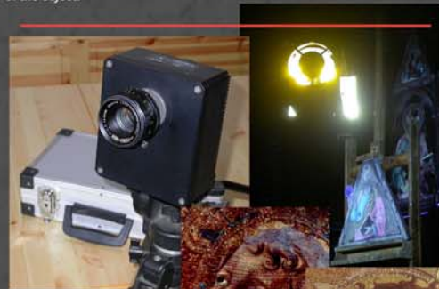
Simone Martini Polittico di Santa Caterina Museo di San Matteo - Pisa: Fotografia RGB (b); Fluorescenza UV multibanda prima e dopo (a) la ricomposizione

CCD cooled scientific camera, 6Mpixel, custom made illuminators and a set of Interferential filters in the 350 -1100 nm range. With this system we are able to provide images of the investigated object in several different wavebands. The multispectral data achieved can be also used to estimate surface spectral reflectance and fluorescence emission. In this way we infer information about the nature and the chemical composition of the materials on it. This information can be acquired at the same time on the whole surface of the object.